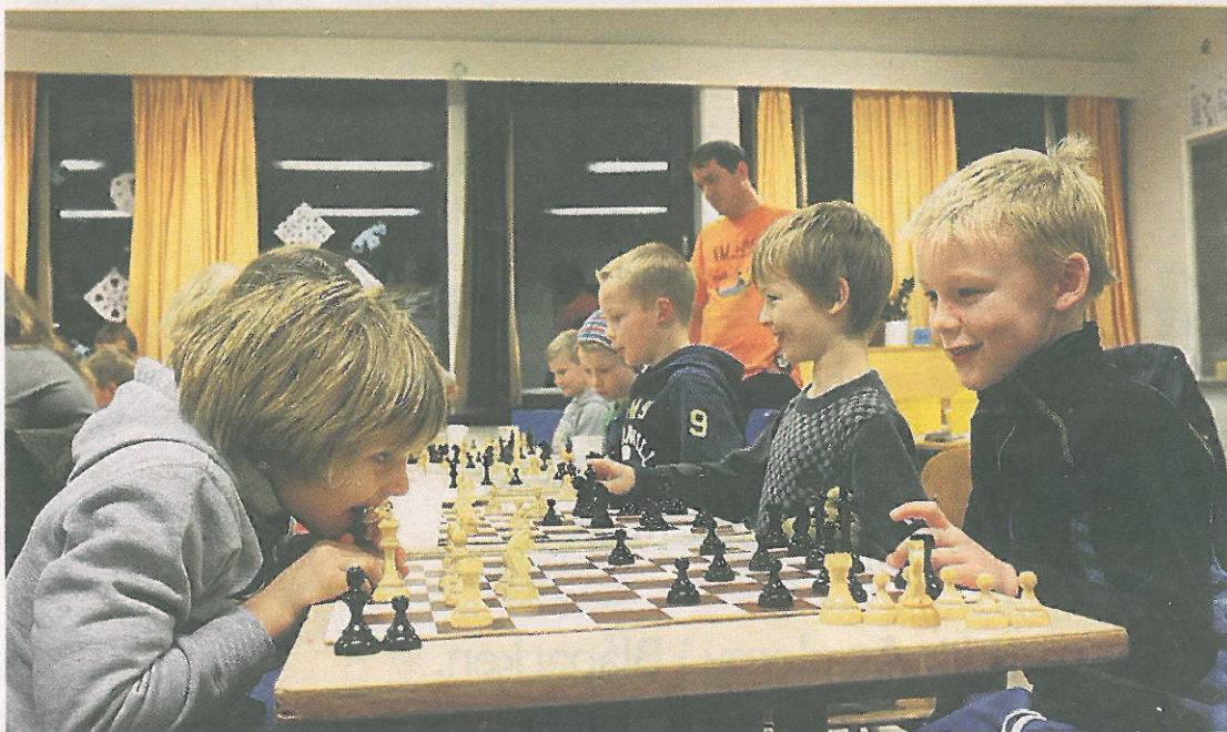
KONSENTRASJON: Kvelden ble avsluttet med et parti sjakk.